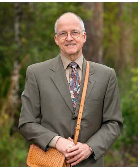
KIF RAKKONTATA MINN CHRISTOF BAUER