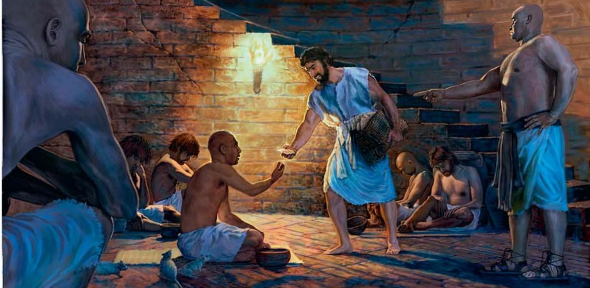
Ġuzeppi hađem iebes fil-habs, u Ġehova bierku

Mill-ktieb tas-Salmi nitgħallmu li Ġuzeppi għad-da minn iżjed torturi: ‘Bl-irbit wegġġhulu saqajh, kien marbut bil-hadid.’ (Salm 105:17, 18) Kultant l-Egizzjani rabtu dirghajn il-prigunieri wara darharhom minn minkbejhom; ohrajn kellhom kul-lari tal-hadid ma’ għonqhom. Min jaf kemm sofru u ġie maltrattat Ġuzeppi—meta ma kien għamel xejn li jisthoqqlu dan kollu!